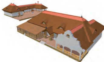
Vizualizácia - takto bude vyzerať kaštieľ Boncz po rekonštrukcii.

to do hlasovania o farbe našej radnice, a že rozvoj obce Vám nie je ľahostajný. Formou ankety pripravujeme aj tému hazardu, keďže nás zaujíma, či občania vôbec