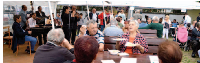
Vlaňajšia zábava na vínom dvore.