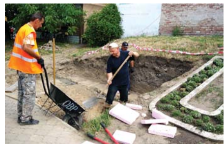
Munkálatok a Híd utcában.