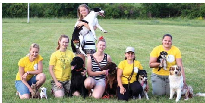
Jótékonyági fellépésen Tótmegyeren.

Bővebb információkat az Udvardi Kinológiai Klub facebook-, illetve weboldalán találnak. (PA)