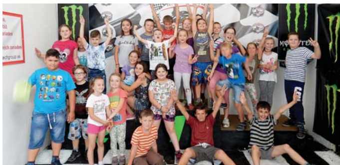
Az idén is gazdag program várta a táborozókat.