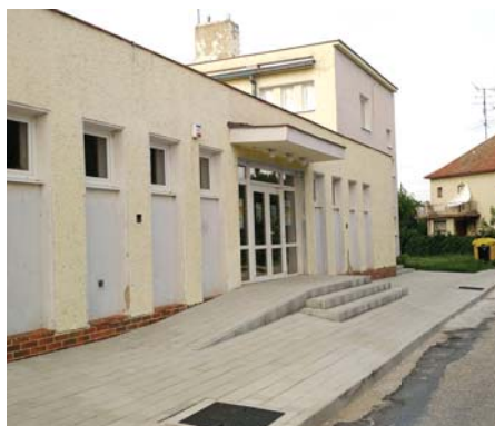
Új térkő a kultúrház előtt.

építeni, mégpedig a faluban is használt térkő lerakásával, ügyelve az egységességre.