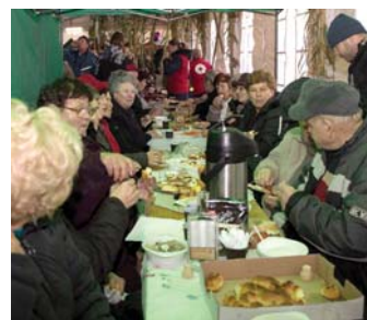
Az elkészített ételeket meg is lehetett kóstolni.