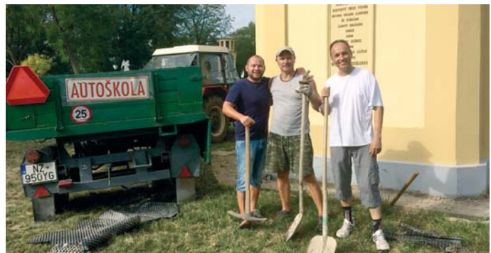
Brigád a Kálvárián – bal oldalon a polgármester, jobb oldalt a plébános, középen pedig az egyik önkéntes.

„Községünkben ismét négy választókörzet lesz kialakítva. Fontos tudnivaló, hogy a választó csak az állandó lakhelyét jelentő helységben szavazhat abban a választókörzetben, amelyben a választók névjegyzékén fel van jegyezve, ezért a szavazói igazolvány kiadása nem kérvényezhető,” számolt be Vadkerti I., a választások szervezési és technikai előkészítéséért és lefolytatásáért felelős személy. (PA)