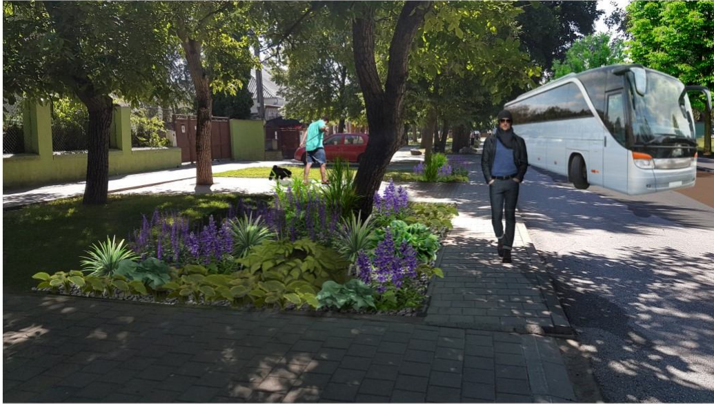
Autor vizualizácie: Peter Uhrin