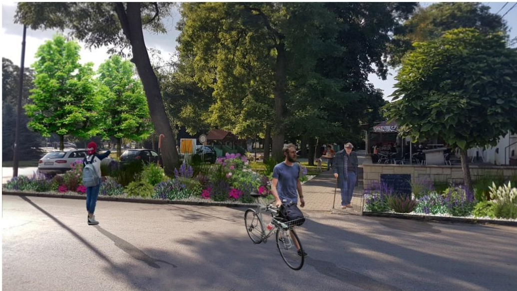
Autor vizualizácie: Peter Uhrin